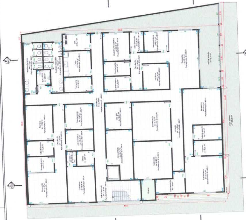
1 Pav. Térreo 1:150