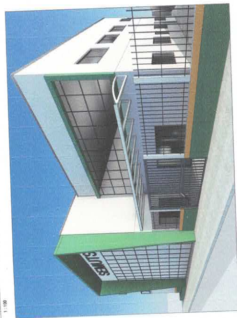
3 Perspectiva 01

CONFERRA TODAS AS MEDIDAS ANTES DA EXECUÇÃO DO PROJETO