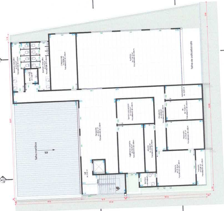
2 Pav. Superior 1:110