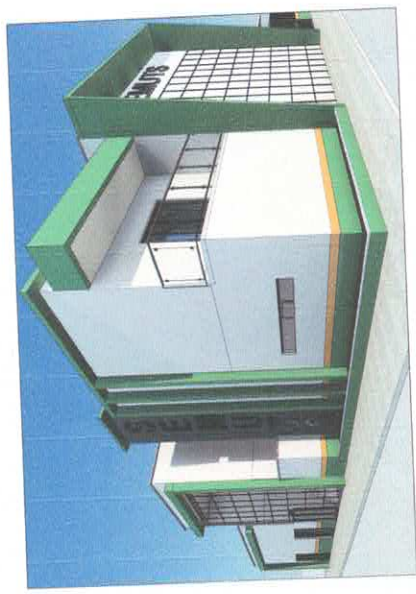
4 Perspectiva 02