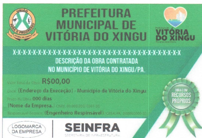
Figura 01 – Modelo placa de obra

Observação: Será fornecida modelo de placa e ao término dos serviços, a CONTRATADA se obriga a retirar a placa da obra, tão logo seja solicitado pela FISCALIZAÇÃO.