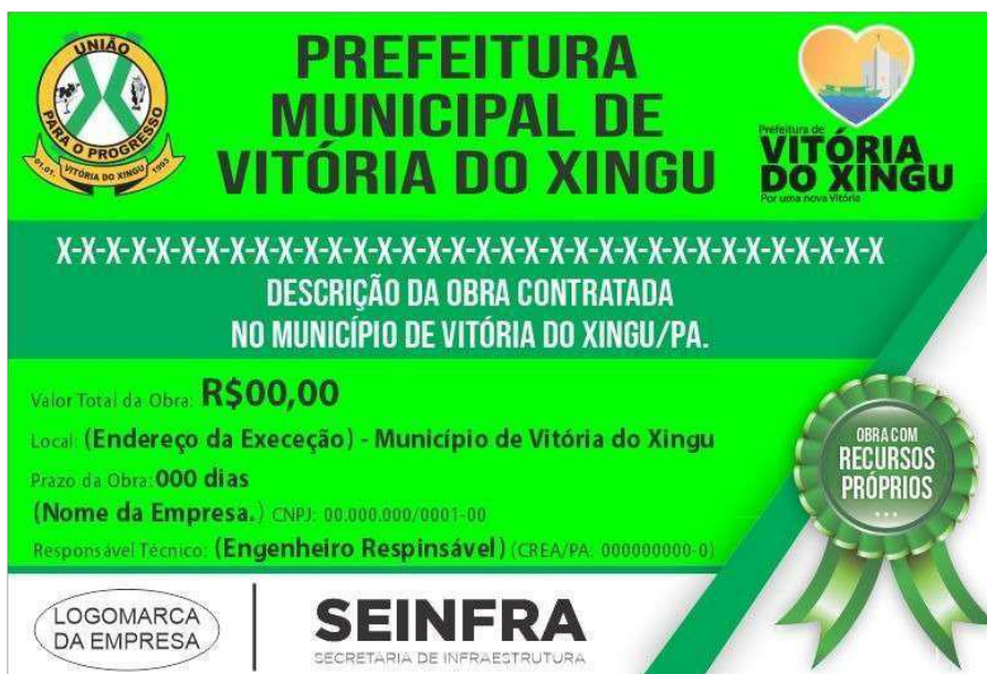
Figura 1 - Placa de obra - H: 2,00 x L: 3,00