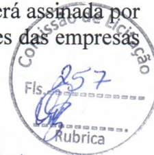
AMHE COMÉRCIO LTDA Participante