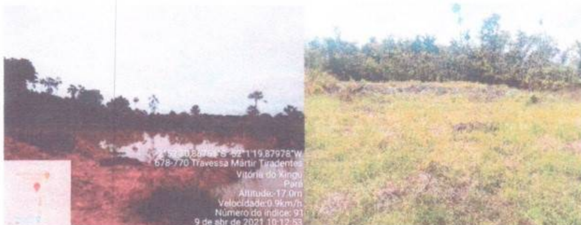
Figura 7 e 8. Registros fotográficos que apresentam áreas com situações distintas a serem atendidas com escavação e/ou reforma e ampliação das áreas de cultivo.

Decorrente da falta de maquinários suficientes para atender essa demanda a SEMAPA/VTX que hoje é de 72 viveiros escavados entre construção, reforma e ampliação de área de cultivo. Visto que a demanda é muito alta para o município e a secretaria de Agricultura que apresenta deficiência de maquinários específicos para atender essa demanda hoje existente de 73 viveiros escavados principalmente no que se refere a hora máquina (Tabela 1). Assim fica claro que a participação e cooperação da SEDAP através das ações do Governo Estadual será possível atender com efetividade os produtores locais e melhorar consideravelmente a produção aquícola no município de Vitória do Xingu.