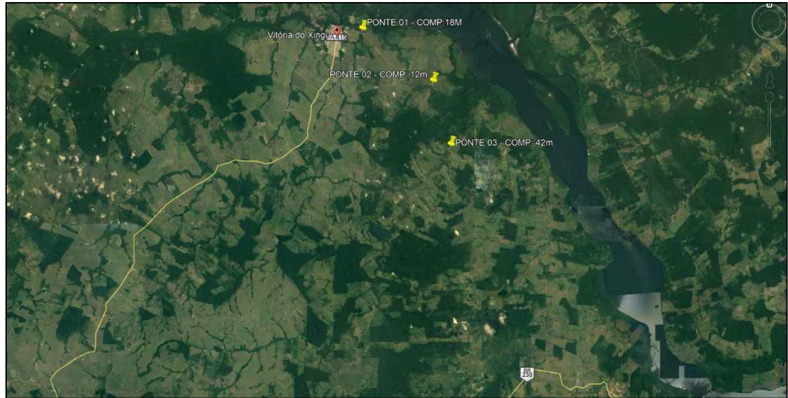
PLANTA DE LOCALIZAÇÃO - SEM ESCALA